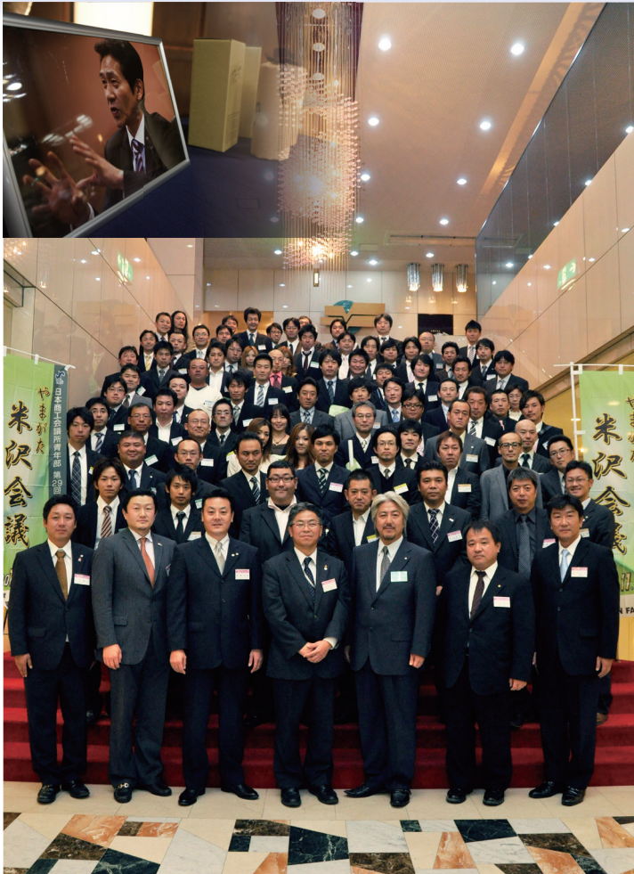
集合写真好評発売中! 2L版 1枚1000円 L版 400円